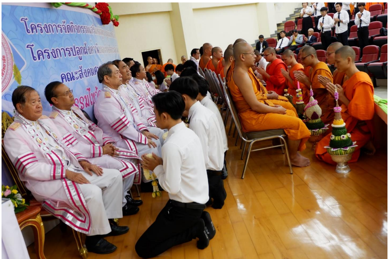
กิจกรรมสามัคคีธรรม ไหว้ครู