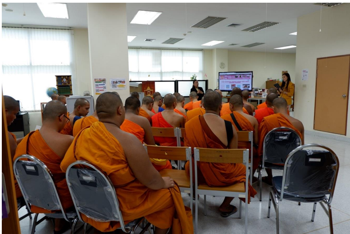
นิสิตรับฟังการบรรยายความรู้เบื้องต้นเกี่ยวกับการใช้ห้องสมุดในมหาวิทยาลัยมหาจุฬาลงกรณราชวิทยาลัย