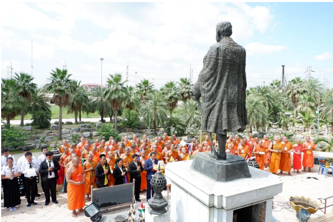
บริหาร คณาจารย์ เจ้าหน้าที่ และนิสิต พร้อมใจกันถวายความจงรักภักดี กล่าวคำปฏิญาณตนหน้า พระบรมรูปพระบาทสมเด็จพระจุลจอมเกล้าเจ้าอยู่หัว มหาราช (ร.๕)