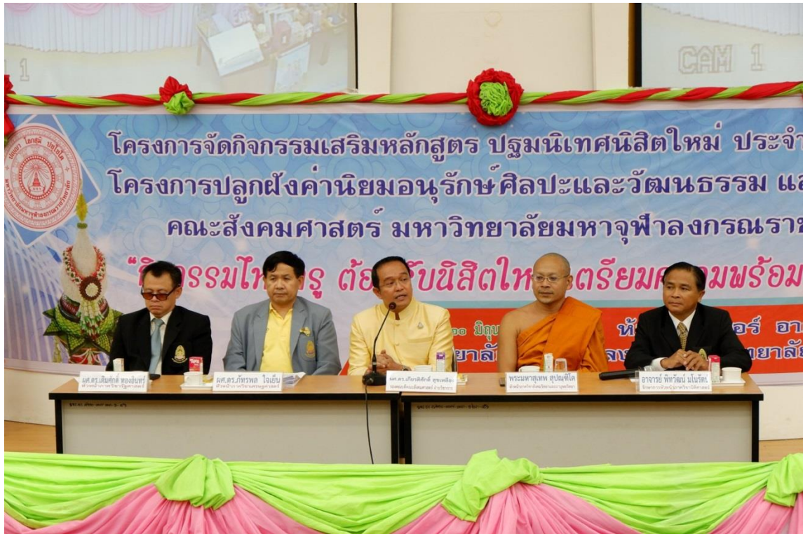
หัวหน้าภาควิชา ชี้แจงหลักสูตรการเรียนการสอน ให้กับนิสิตใหม่