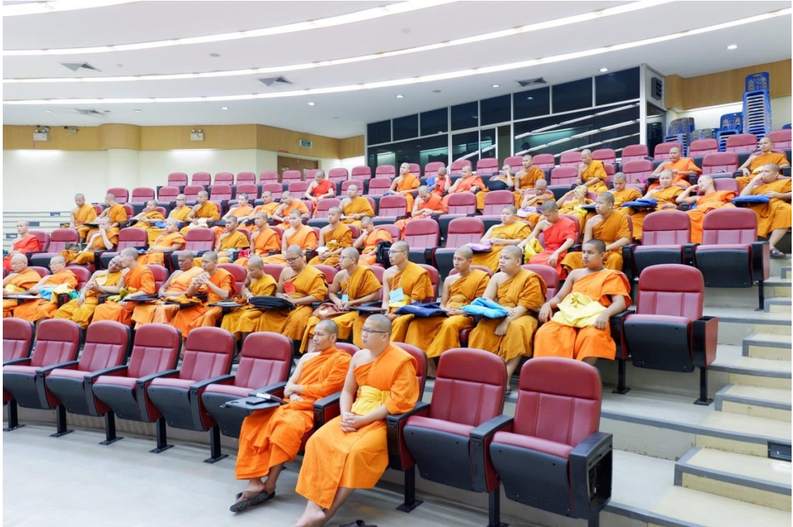
คณาจารย์ เจ้าหน้าที่ และนิสิต เข้าร่วมกิจกรรม “ภาษาอังกฤษง่ายนิดเดียว”