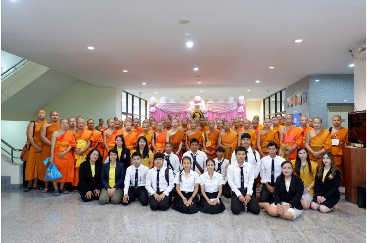
ผู้บริหาร คณาจารย์ เจ้าหน้าที่ และนิสิต ถ่ายรูปหมู่ร่วมกับคณะวิทยากรจาก สำนักหอสมุดและเทคโนโลยีสารสนเทศ