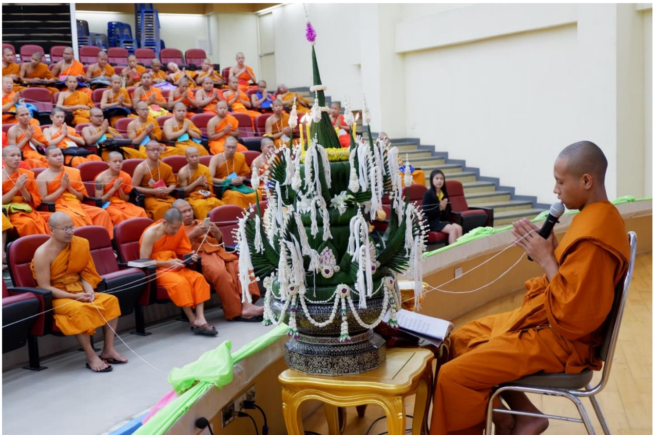
พิธีบายศรีสู่ขวัญ ต้อนรับนิสิตใหม่ ปีการศึกษา ๒๕๖๒