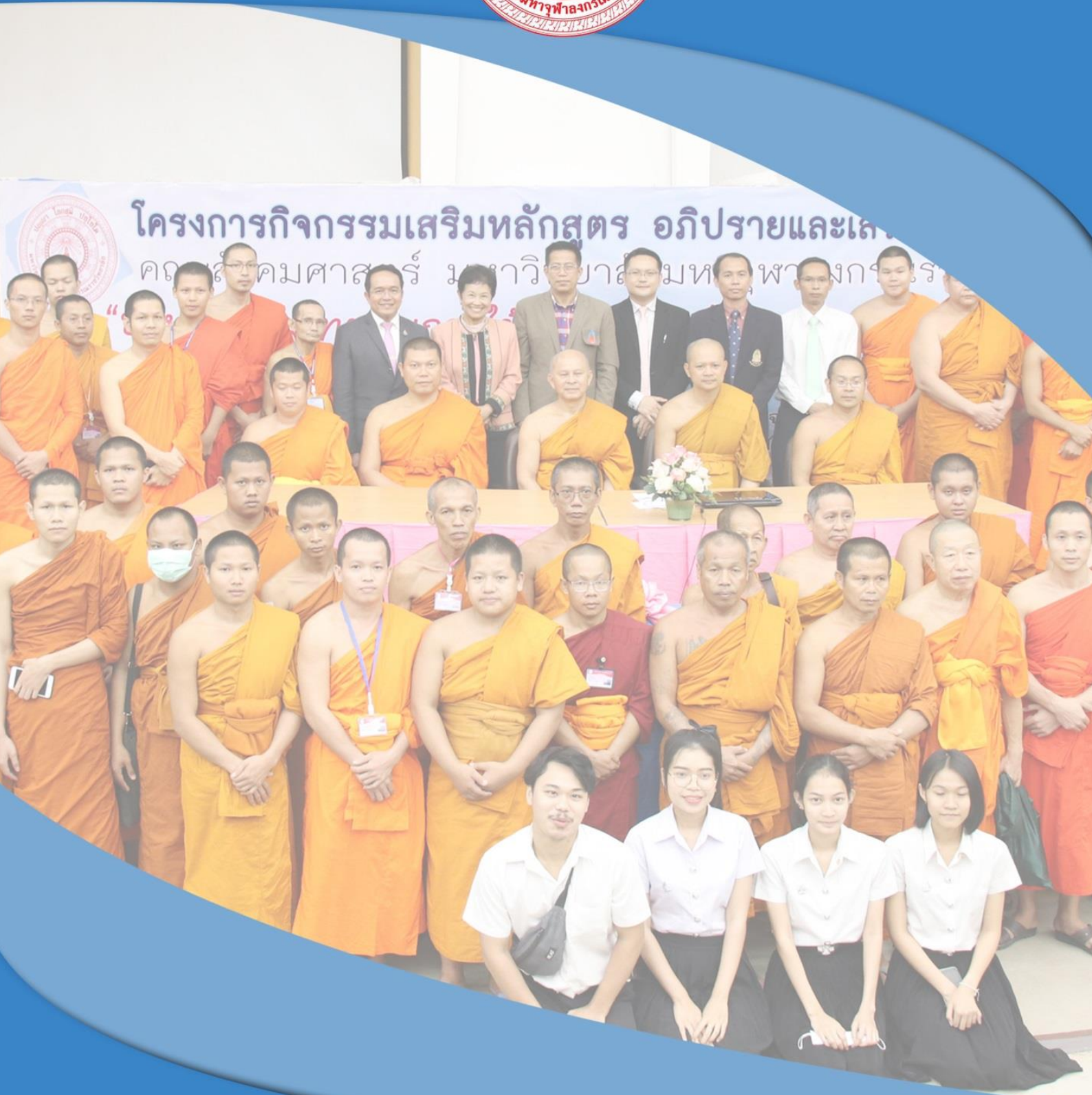
คณะศึกษาศาสตร์ มหาวิทยาลัยมหาจุฬาลงกรณราชวิทยาลัย ตำบลลำไทร อำเภอน้อย จังหวัดพระนครศรีอยุธยา