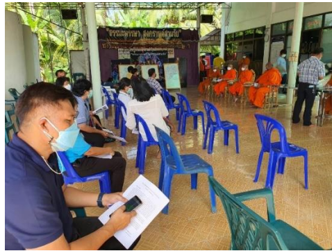
Figure 1: (Name of the figure, if any))