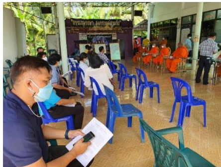
ภาพที่ 1 (ชื่อภาพ) (ถ้ามี)