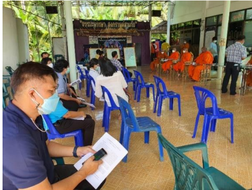
ภาพที่ 1 (ชื่อภาพ) (ถ้ามี)