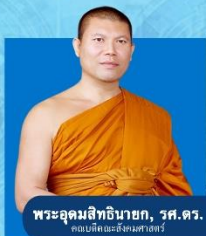
พระอุดมสิทธินายก, วศ.ศร. คณบดีคณะสังคมศาสตร์